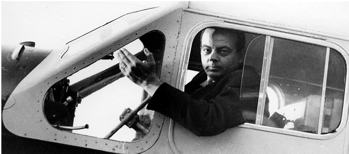
Figura 4 -Antoine de Saint Exupery la bordul avionului său 2

Înainte să plece, Micul prinț îi spune pilotului: „Pe una dintre stele voi locui, pe una voi râde, și toate stelele vor părea că râd atunci când te vei uita pe cerul înstelat”. Uneori trebuie să-i lași pe oameni să plece, căci păstrându-i, îi vei amăgi. Dar lăsându-i liberi poate fi cea mai adevărată dovadă de iubire.