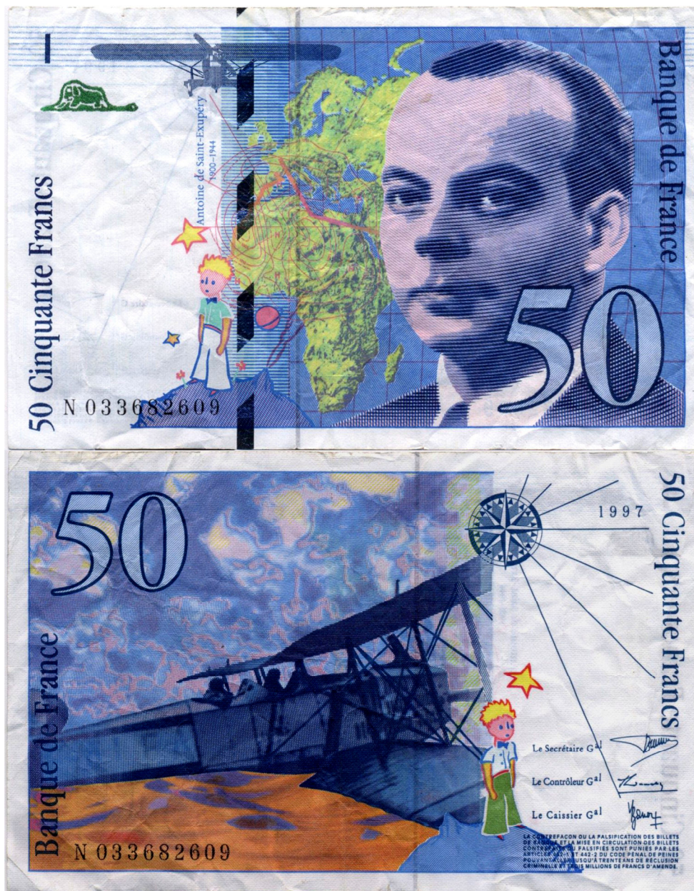
Figura 1 –bancnota franceză de 50 franci 1997

Călătoria numismatică mi-a adus din întâmplare în atenție o bancnotă deosebită. Doresc s-o prezint cititorilor întrucât ne spune o frumoasă poveste pentru copii, și pentru oameni mari în același timp.